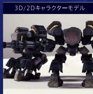
3D/2Dキャラクターモデル