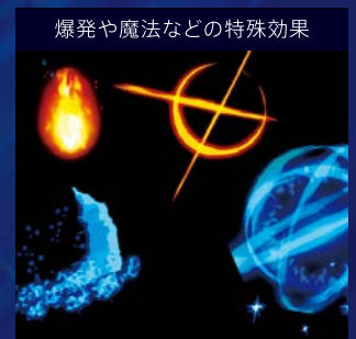
爆発や魔法などの特殊効果