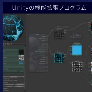
Unityの機能拡張プログラム